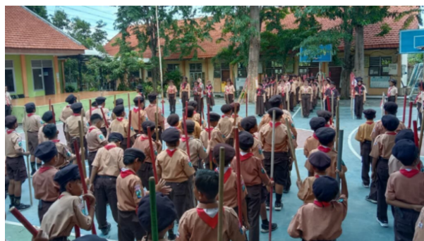
Gambar 1. Kegiatan upacara penggalang yang menunjukkan kedisiplinan siswa

Hasil observasi menunjukkan bahwa nilai disiplin diterapkan melalui pembiasaan nyata. Pada observasi awal, sebagian besar siswa telah hadir tepat waktu dan mengikuti kegiatan dengan tertib, meskipun masih terdapat beberapa siswa yang belum konsisten. Namun, pada pertemuan berikutnya terlihat peningkatan, di mana siswa hadir tepat waktu tanpa diingatkan, membawa perlengkapan lengkap, serta mengikuti kegiatan dengan tertib, sebagaimana terlihat pada pelaksanaan upacara penggalang yang berlangsung secara teratur dan tertib.